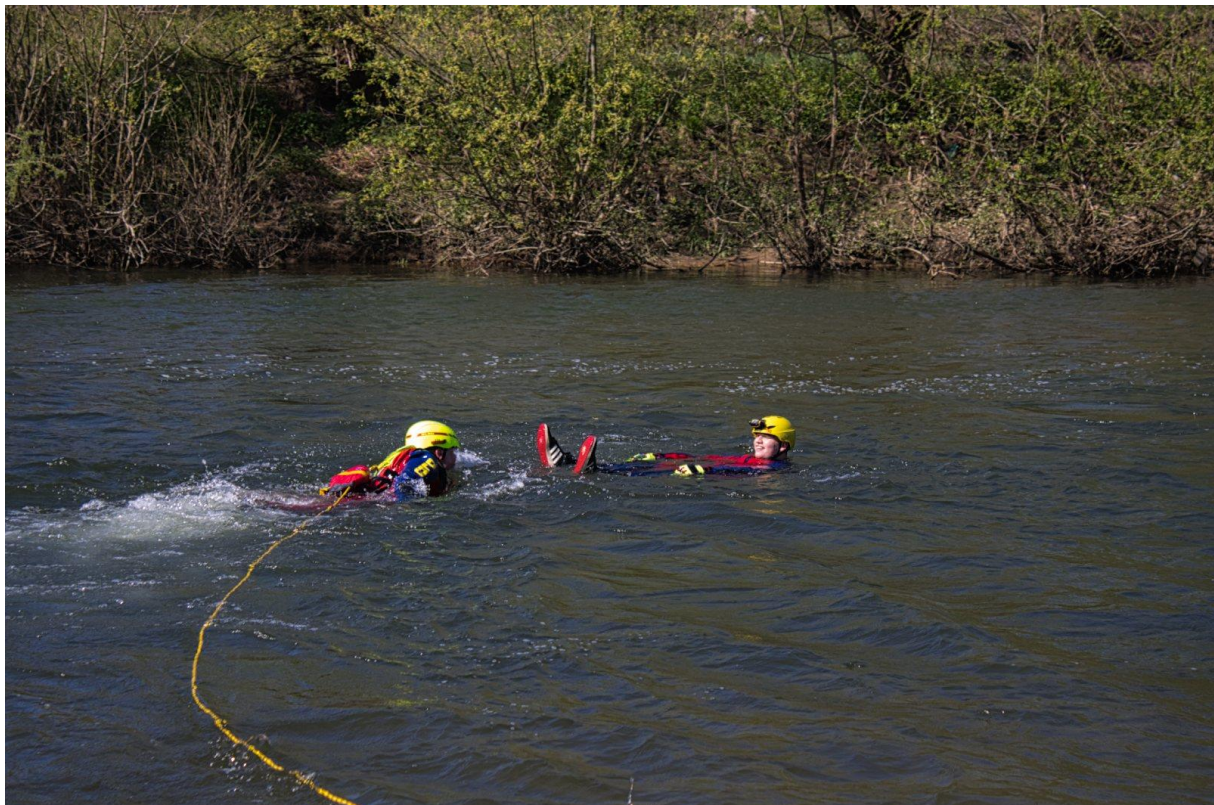
Abbildung 5: schwimmerische Rettung im Fließgewässer (Übung)

Unsere Ortsgruppe verfügt über mehrere Strömungsretter der Stufe 1 und 2. Dazu stellen wir eine auf die hubschrauber-gestützte Wasserrettung spezialisierte Einsatzkraft (ARS – Air-Rescue-Specialist), welche in Kooperation mit dem DRK und der Bundespolizei eingesetzt wird.