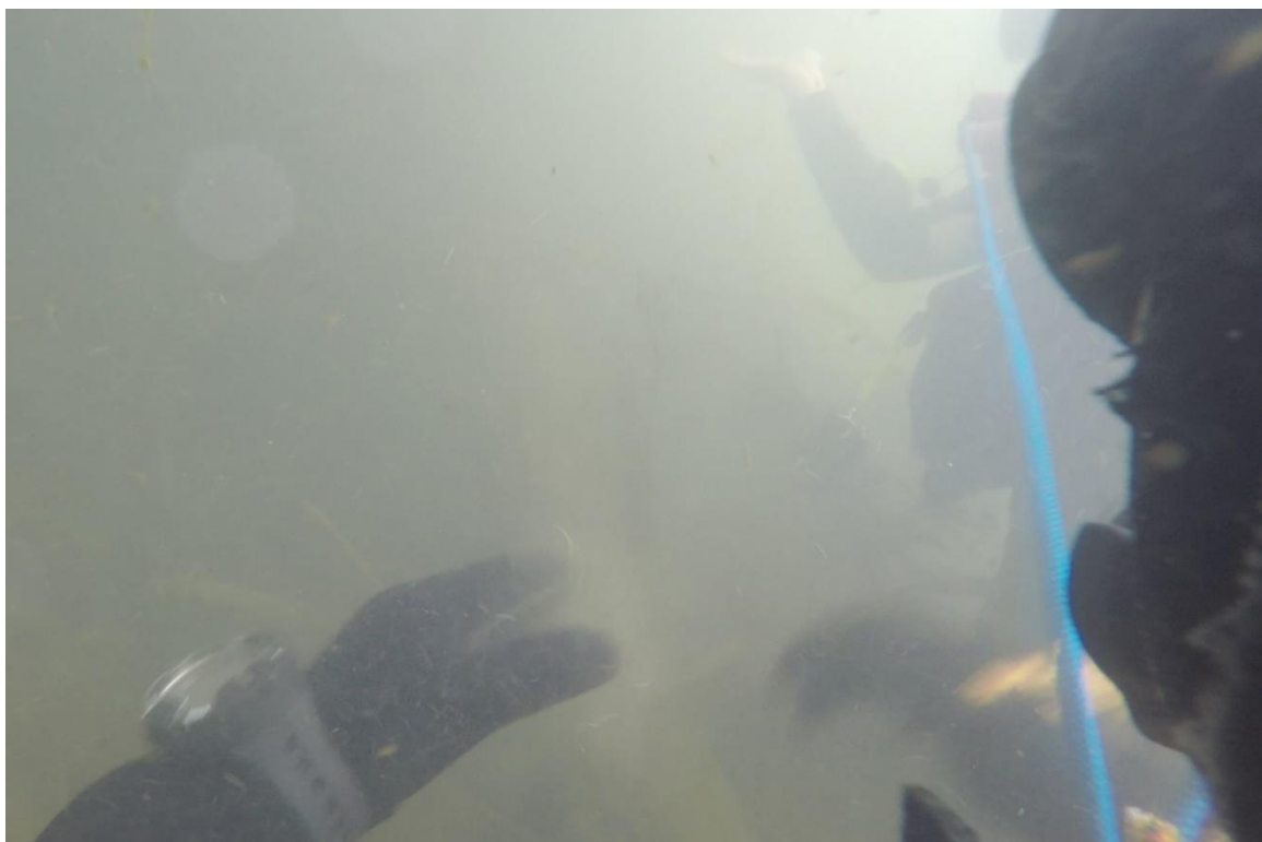
Abbildung 6: Taucherausbildung im strömenden Gewässer

Die Ortsgruppe Troisdorf bietet regelmäßig Termine zum Tauchen nach GUV-Regeln an, um die Lizenz zu erhalten. Weiterhin bieten diese Termine die Möglichkeit, praktische Erfahrung als Signalmann zu sammeln.