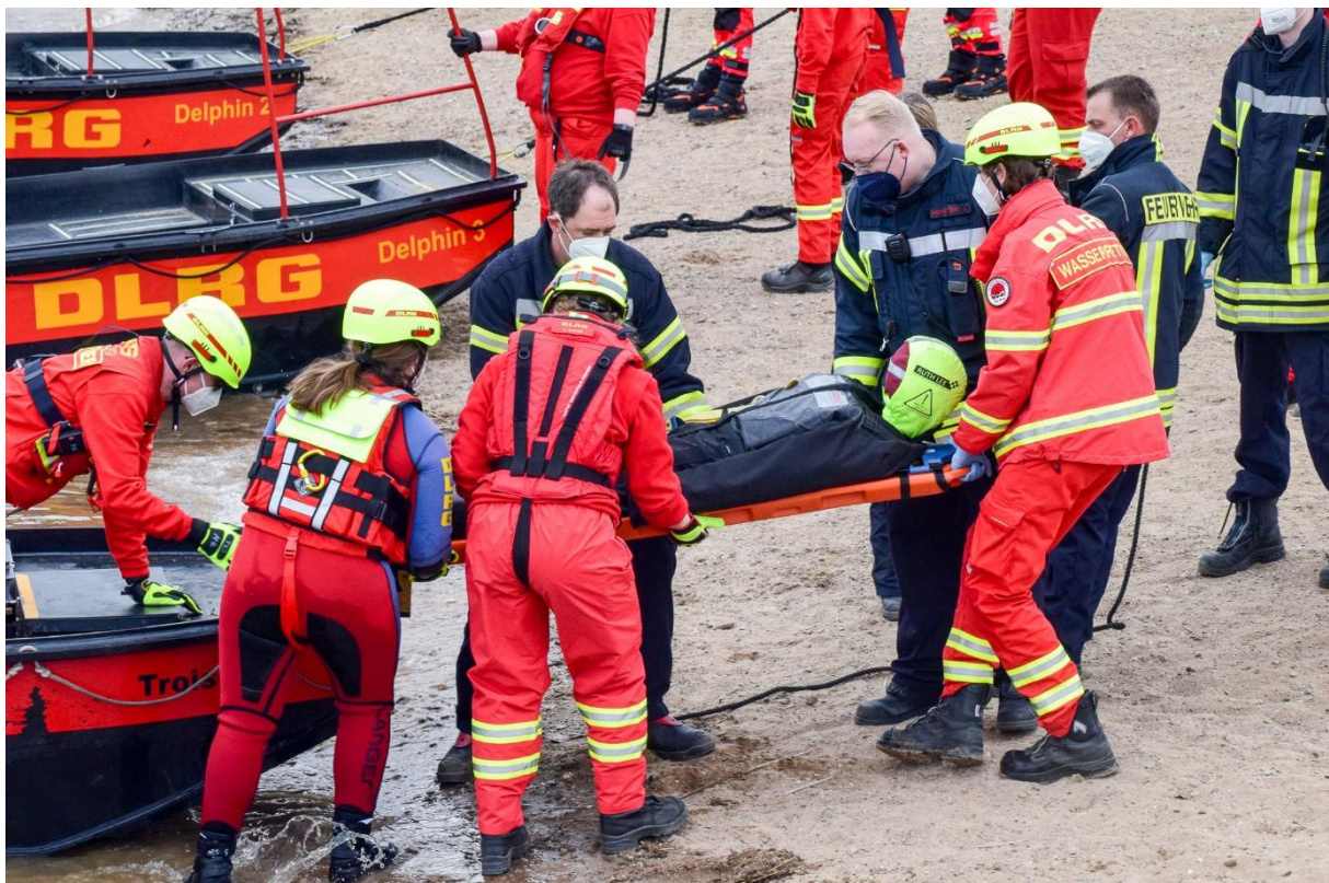
Abbildung 4: Patientenübergabe mit der Feuerwehr (Übung)

Neben der originären Aufgabe der Wasserrettung können die Fahrzeuge und das Personal der Wasserrettungszüge auch für Unterstützungsaufgaben bei anderen Einsätzen herangezogen werden.