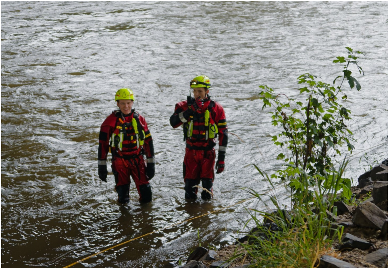
Abbildung 5: Strömungsretter suchen das Ufer ab. (Übung)

Unsere Ortsgruppe verfügt über mehrere Strömungsretter der Stufe 1 und 2. Dazu stellen wir eine auf die hubschrauber-gestützte Wasserrettung spezialisierte Einsatzkraft (ARS – Air-Rescue-Specialist), welche in Kooperation mit dem DRK und der Bundespolizei eingesetzt wird.