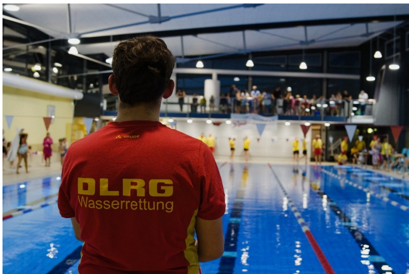
Abbildung 2: Schwimmbad zur Trainingszeit

Ergänzend dazu bieten wir auch Erste-Hilfe- und Sanitätskurse an, in denen den Teilnehmenden vermittelt wird, wie in einem Notfall geholfen und Leben gerettet werden können.