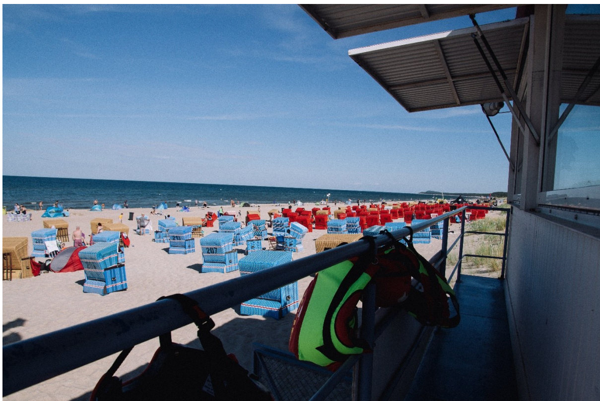
Abbildung 3: Blick von einer Wachstation auf Usedom

Darüber hinaus nimmt die Ortsgruppe am Wasserrettungsdienst am Rotter See teil. Hier sorgen wir als Teil des Bezirks Rhein-Sieg an Wochenenden und Feiertagen ehrenamtlich für die Sicherheit der Badegäste.